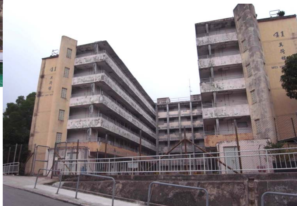
Existing Building 樓宇現貌

Revitalisation Scheme – Revitalising Mei Ho House as City Hostel 活化歷史建築伙伴計劃 – 活化美荷樓為城市旅舍