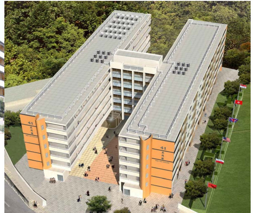
Artistic Impressions of the City Hostel 活化後的模擬圖片

Revitalisation Scheme –Revitalising Mei Ho House as City Hostel 活化歷史建築伙伴計劃 – 活化美荷樓為城市旅舍