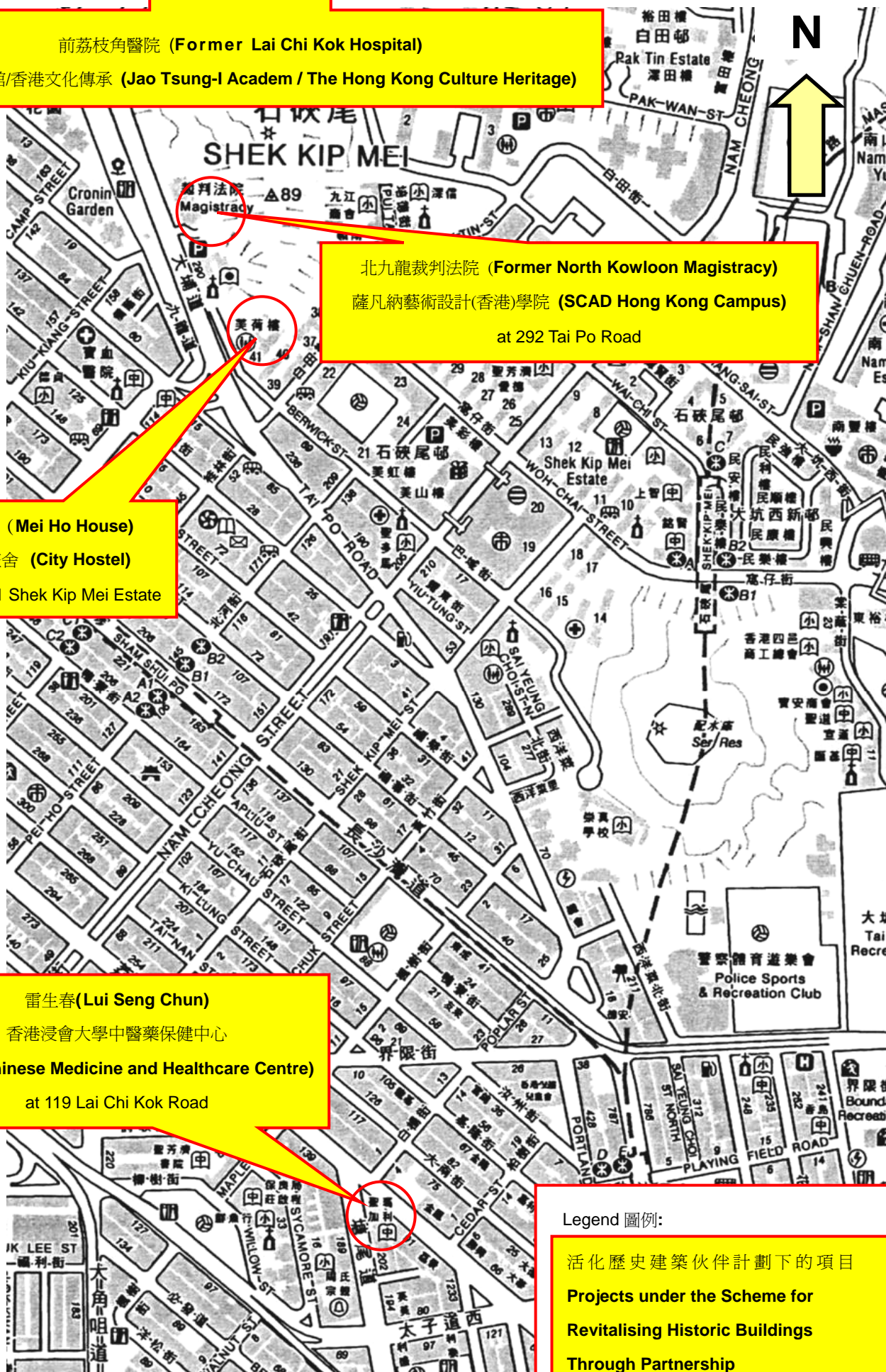
SITE PLAN 位置圖

活化歷史建築伙伴計劃下的項目 Projects under the Scheme for Revitalising Historic Buildings Through Partnership