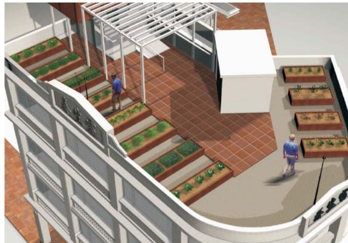
Artistic Impressions of the City Hostel 活化後的模擬圖片

Revitalisation Scheme – Revitalising Lui Seng Chun as the HKBU Chinese Medicine and Healthcare Centre 活化歷史建築伙伴計劃 - 活化雷生春為香港浸會大學中醫藥保健中心