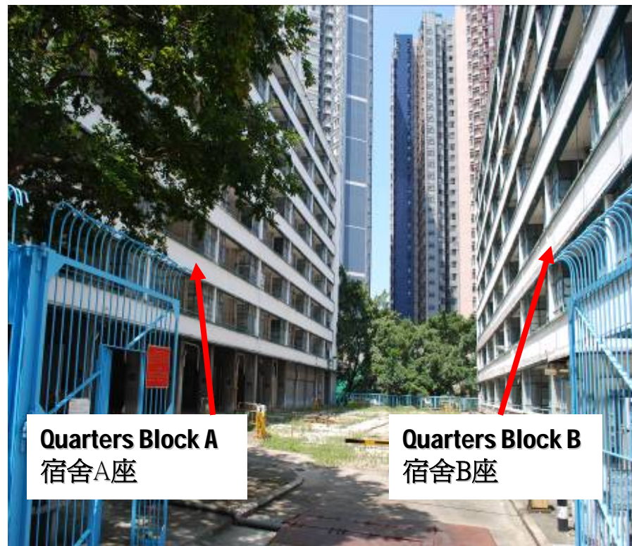
Quarters Block A 宿舍A座