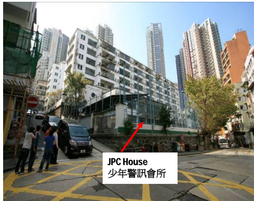
JPC House 少年警訊會所