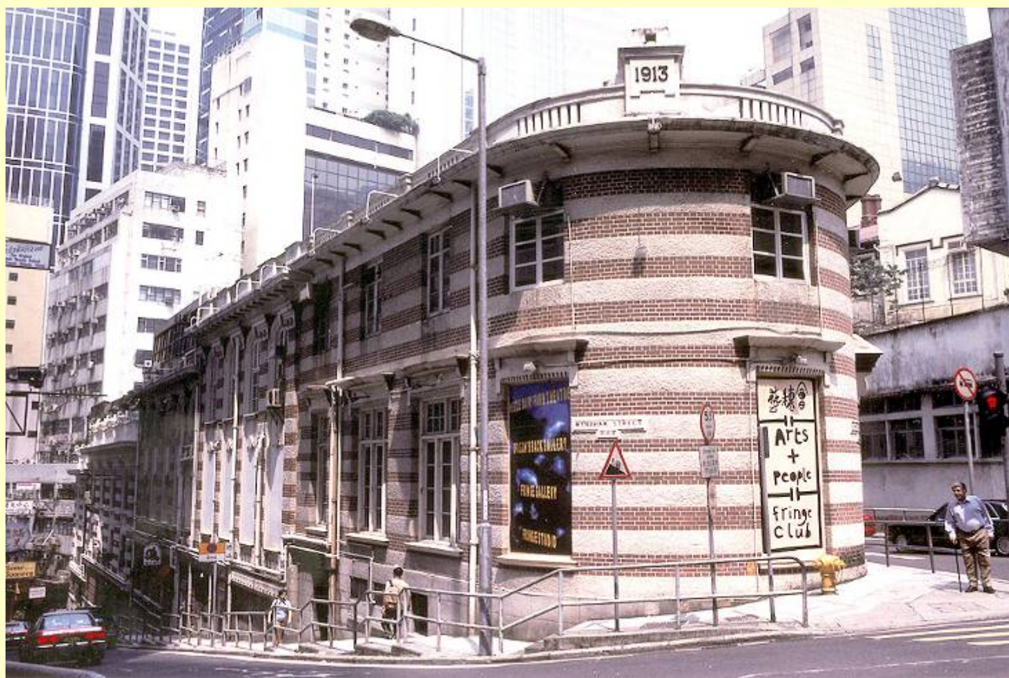
二級文物建築：舊牛奶公司寫字樓(藝穗會)