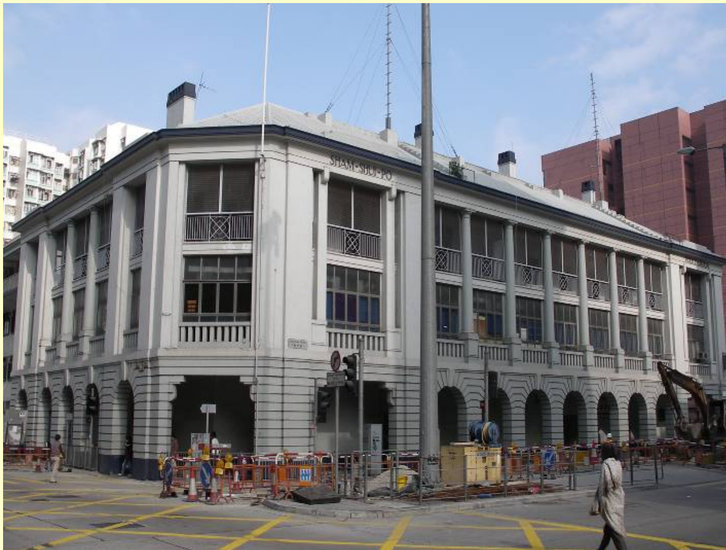
三級文物建築：深水埗警署