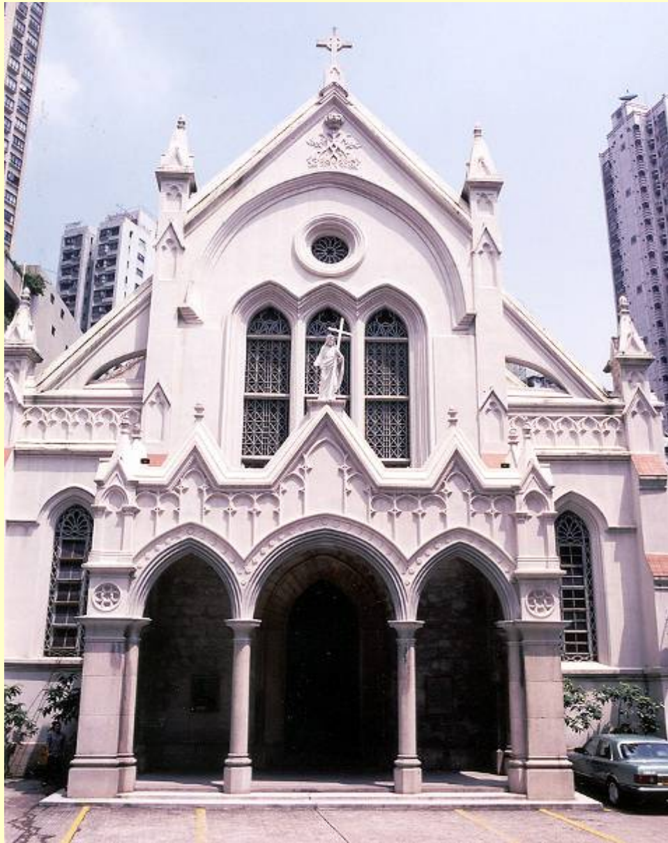
一級文物建築： 聖母無原罪主教座堂