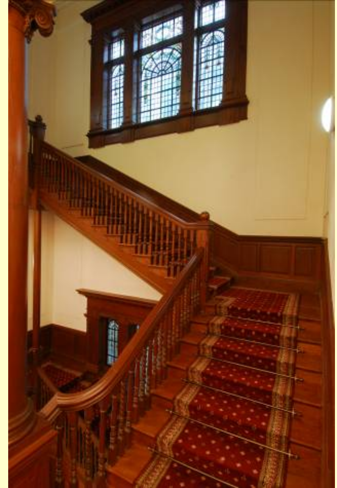
甘棠第：已改建為孫中山紀念館