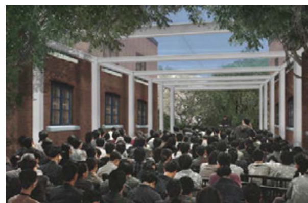
有蓋庭園/戶外表演場地及活動場地