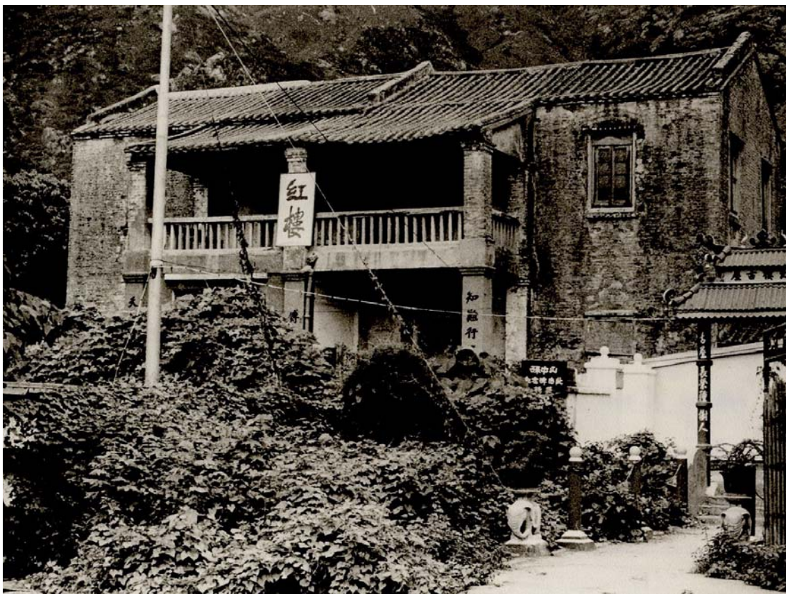
紅樓（攝於一九七七年）