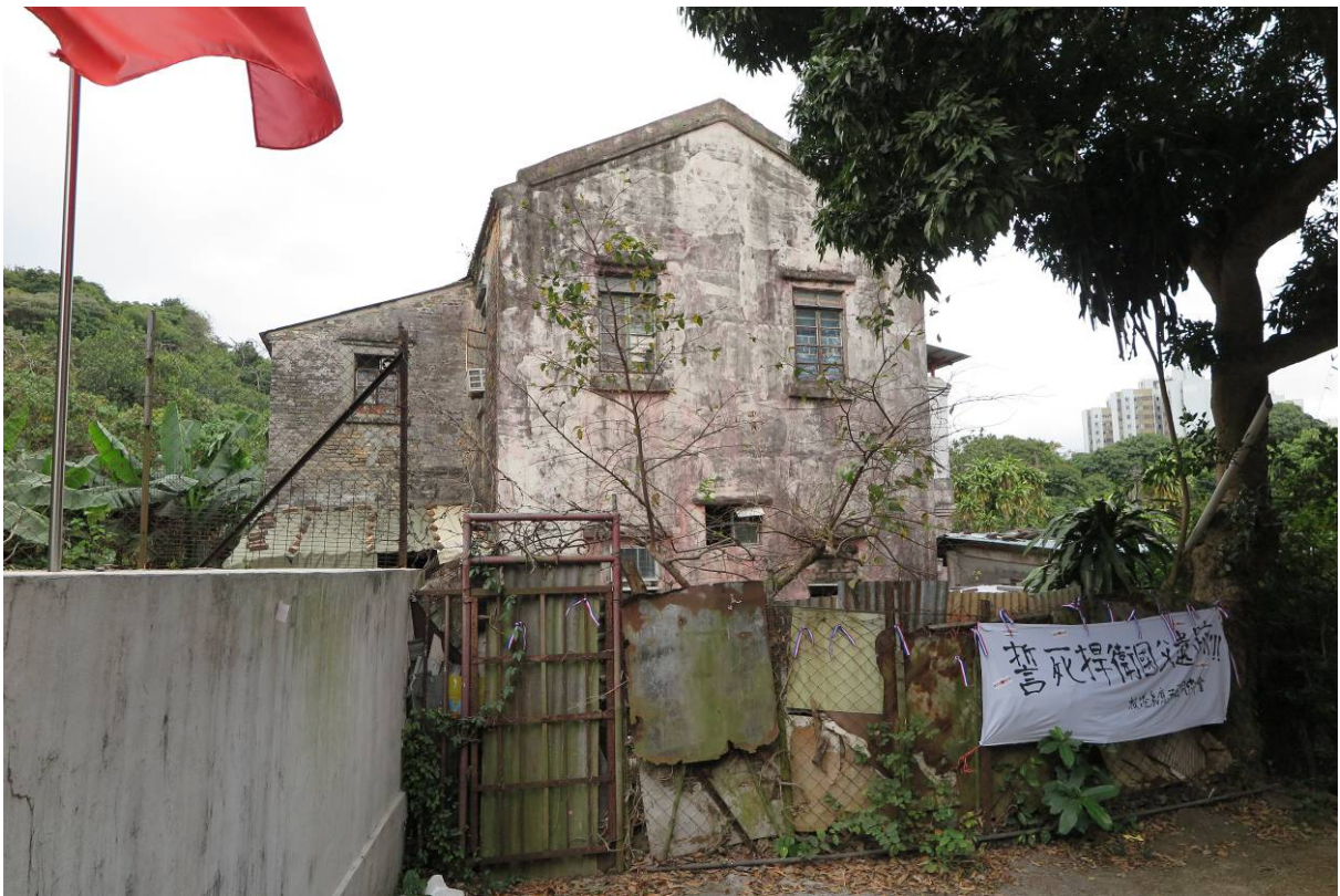
紅樓側影（攝於二零一七年二月二十一日）