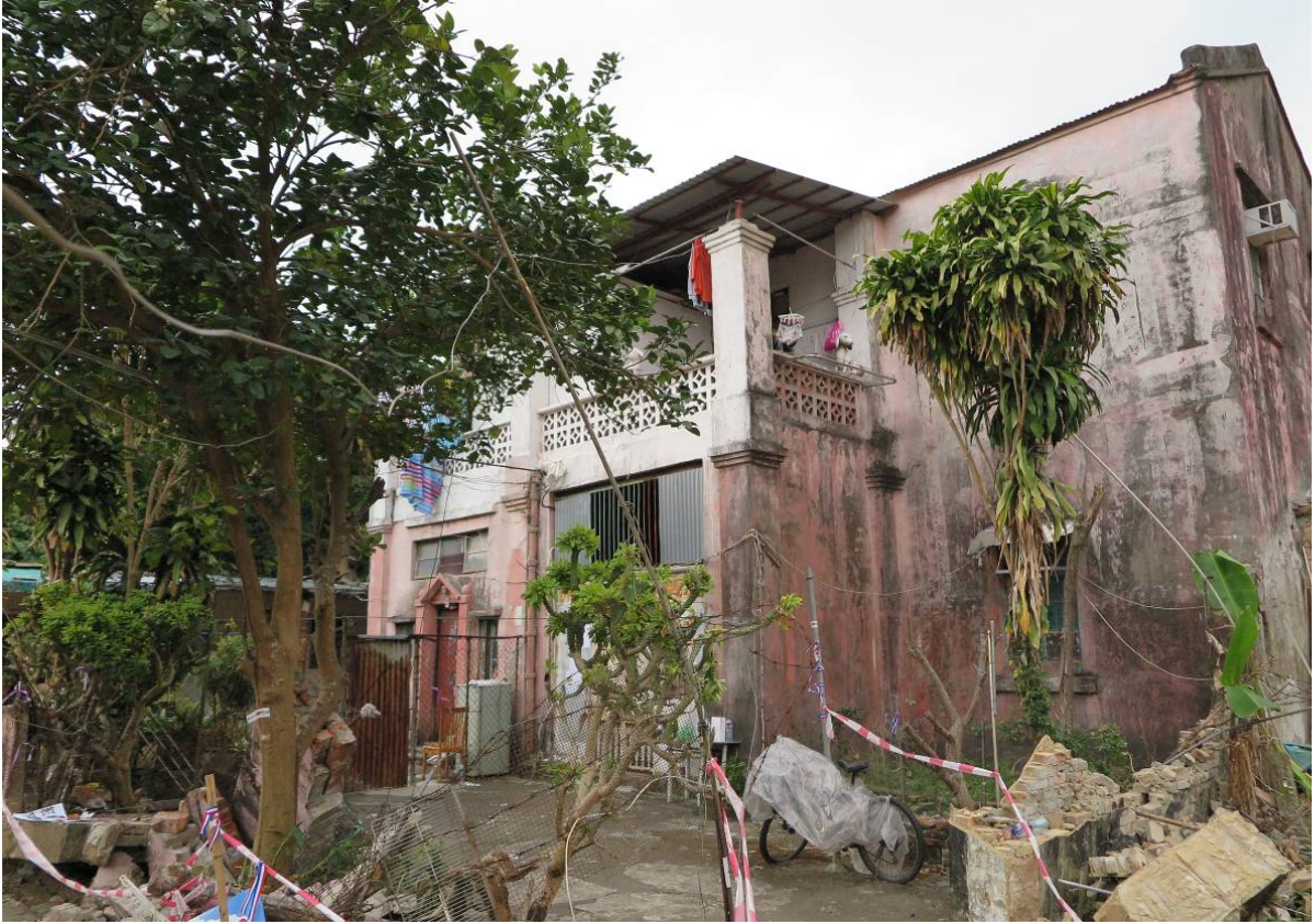
紅樓（攝於二零一七年二月二十一日）