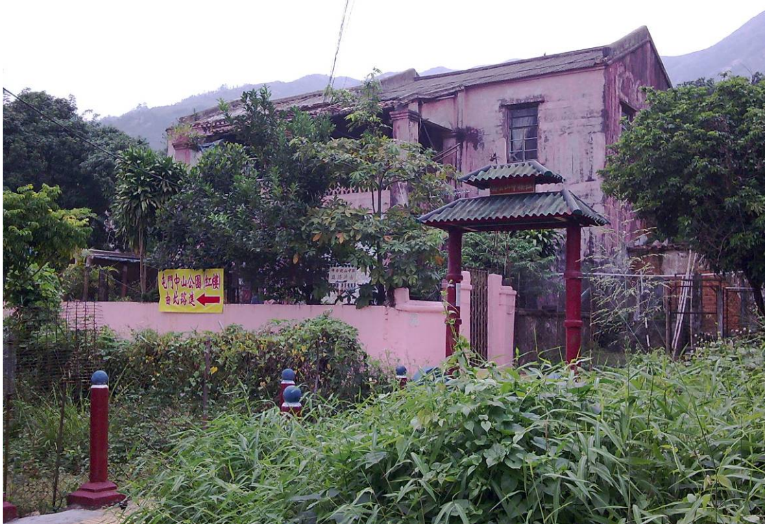
紅樓（攝於二零零九年）