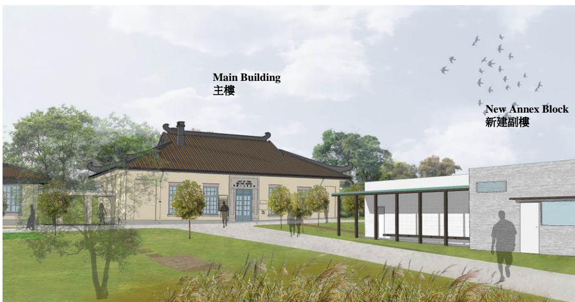
Artist's Impression of Lady Ho Tung Welfare Centre Eco-Learn Institute 何東夫人醫局・生態研習中心的模擬圖片

Revitalisation of the Lady Ho Tung Welfare Centre into Lady Ho Tung Welfare Centre Eco-Learn Institute 活化何東夫人醫局為何東夫人醫局・生態研習中心