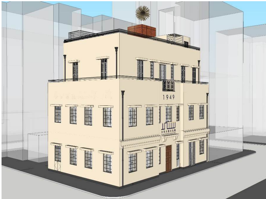
Artist's Impression of Tai Hang Fire Dragon Heritage Centre 大坑火龍文化館的模擬圖片

Revitalisation of No. 12 School Street into Tai Hang Fire Dragon Heritage Centre 活化書館街12號為大坑火龍文化館