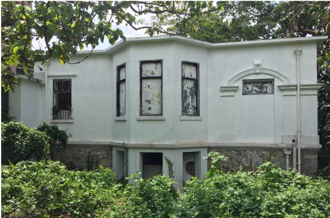
Existing Condition of the Old Dairy Farm Senior Staff Quarters 舊牛奶公司高級職員宿舍的現貌