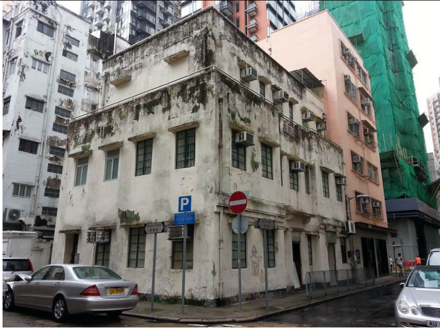
Existing Condition of No. 12 School Street 書館街12號的現貌