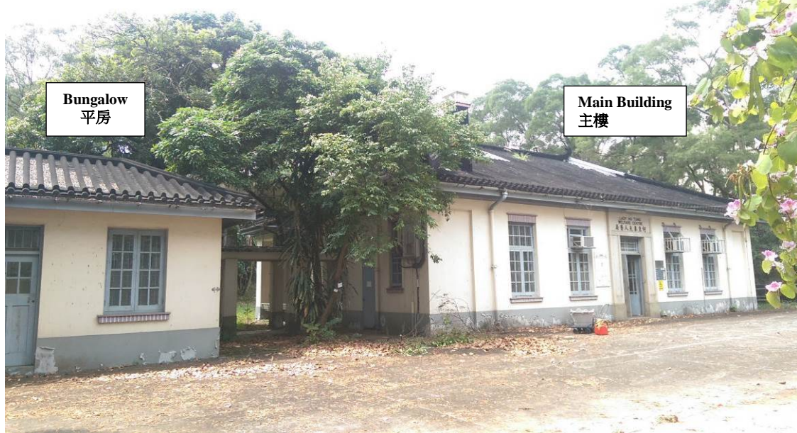
Existing Condition of the Lady Ho Tung Welfare Centre 何東夫人醫局主樓及平房的現貌