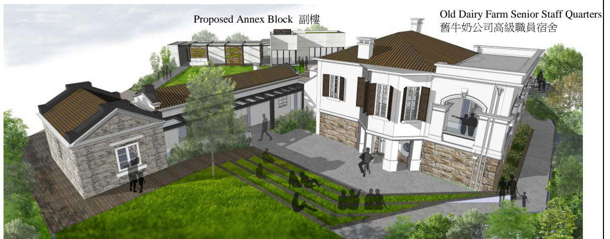
Artist's Impression of The Pokfulam Farm 薄覺林牧場的模擬圖片

Revitalisation of the Old Dairy Farm Senior Staff Quarters into The Pokfulam Farm 活化舊牛奶公司高級職員宿舍為薄覺林牧場