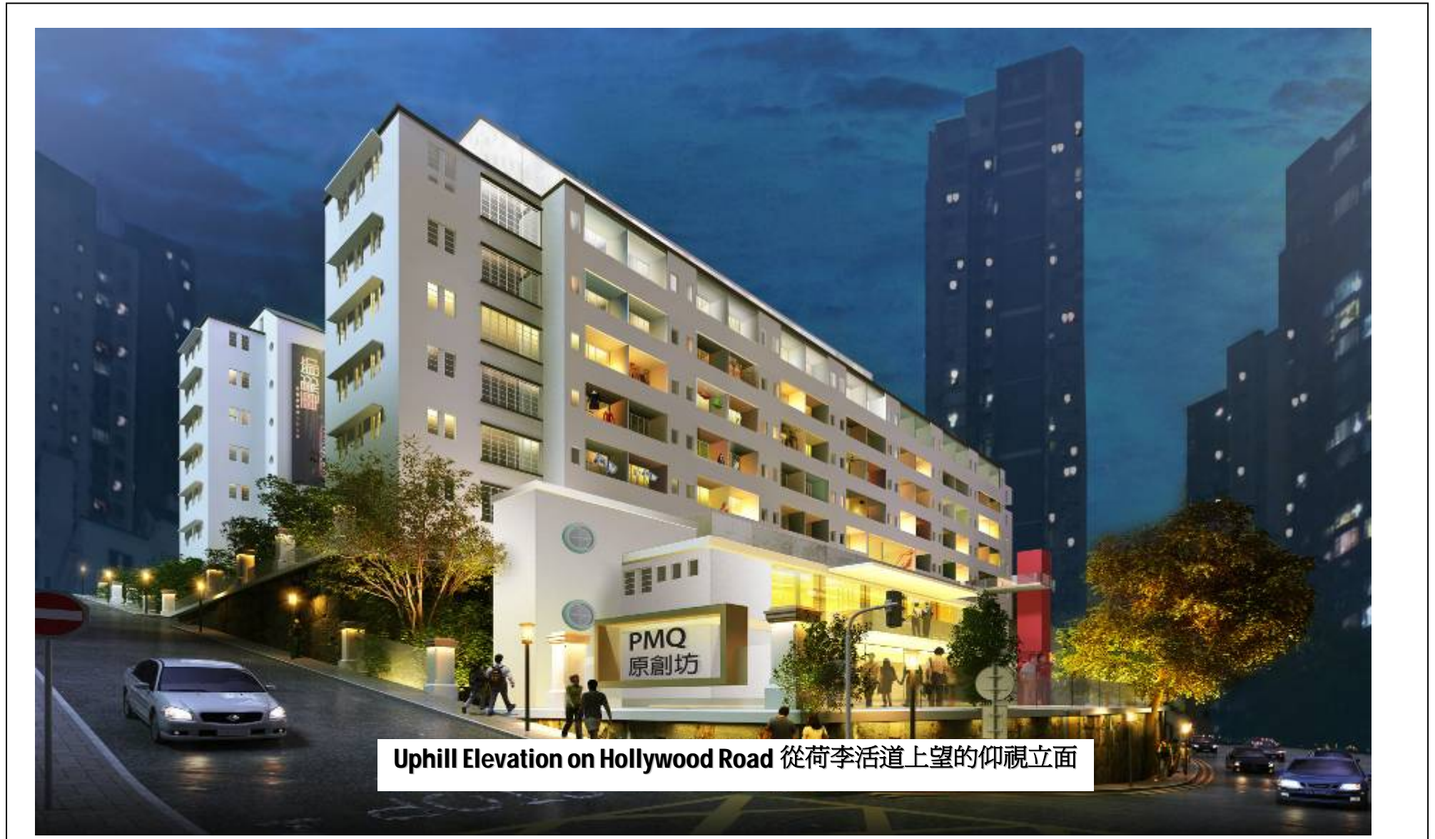
Uphill Elevation on Hollywood Road 從荷李活道上望的仰視立面