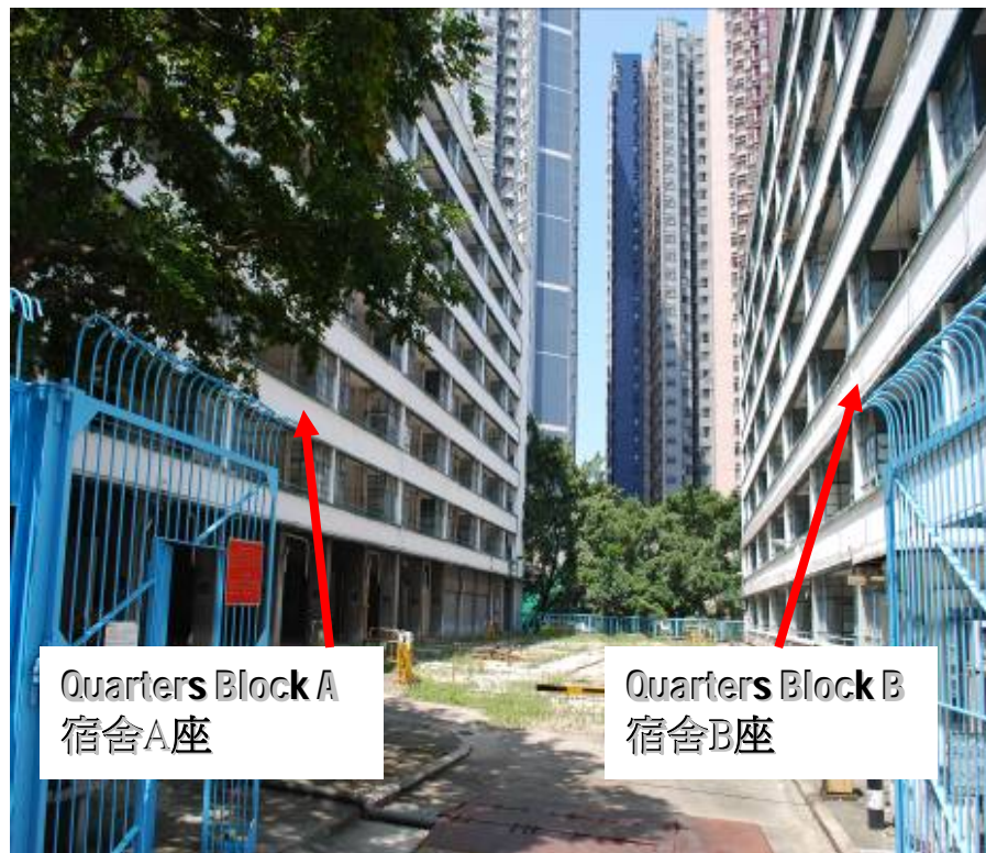
Quarters Block A 宿舍A座