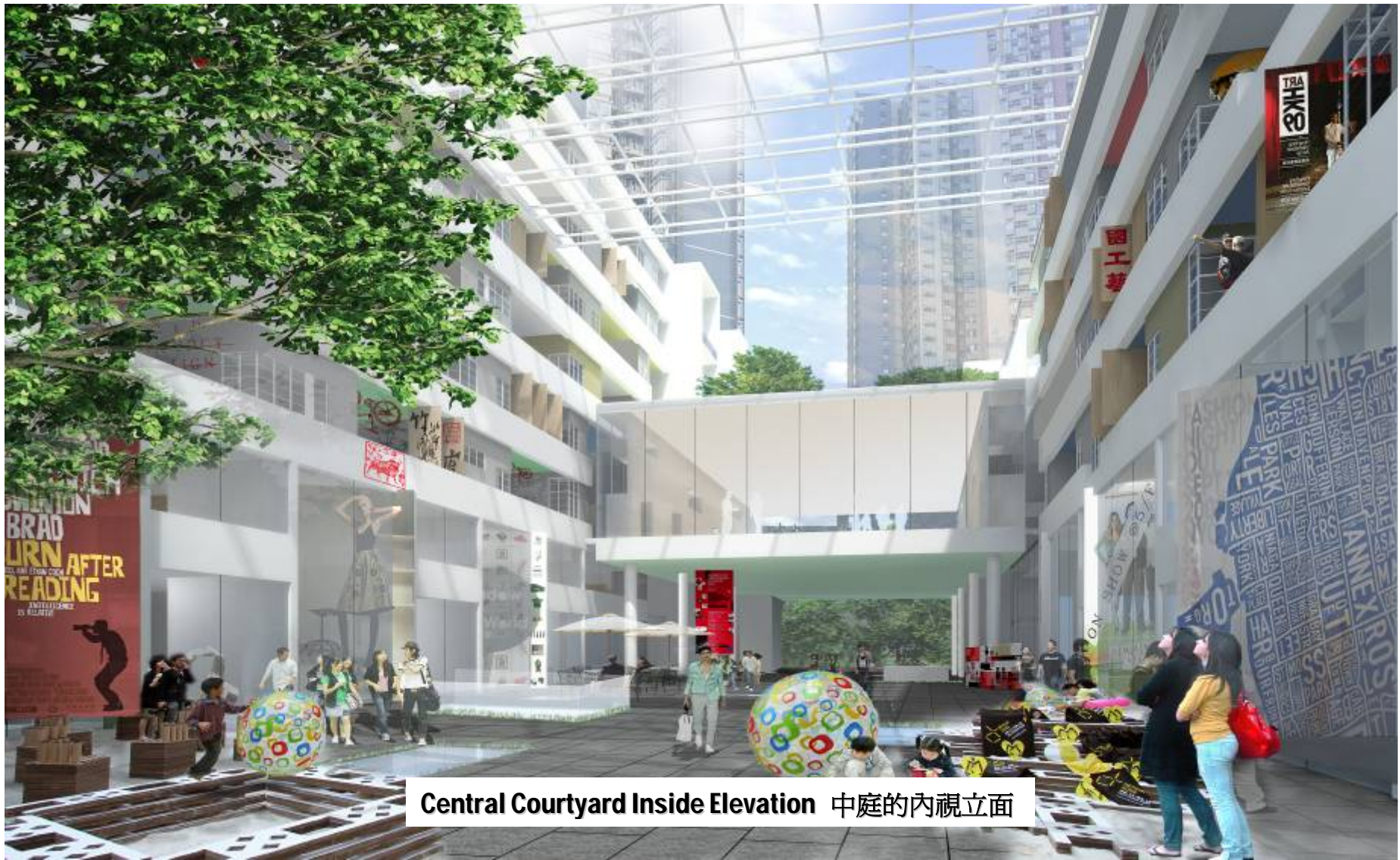
Central Courtyard Inside Elevation 中庭的內視立面