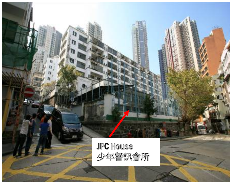
JPC House 少年警訊會所