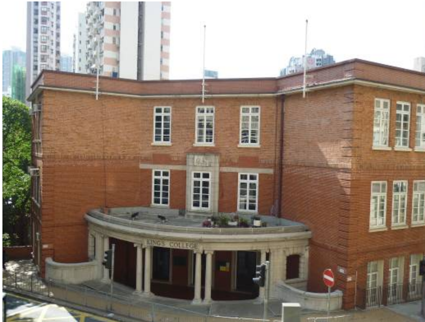
英皇書院的正門入口

（建於1929年），在半山區合組成一個具歷史價值的學校建築羣。這些建築物都已被列為法定古蹟。