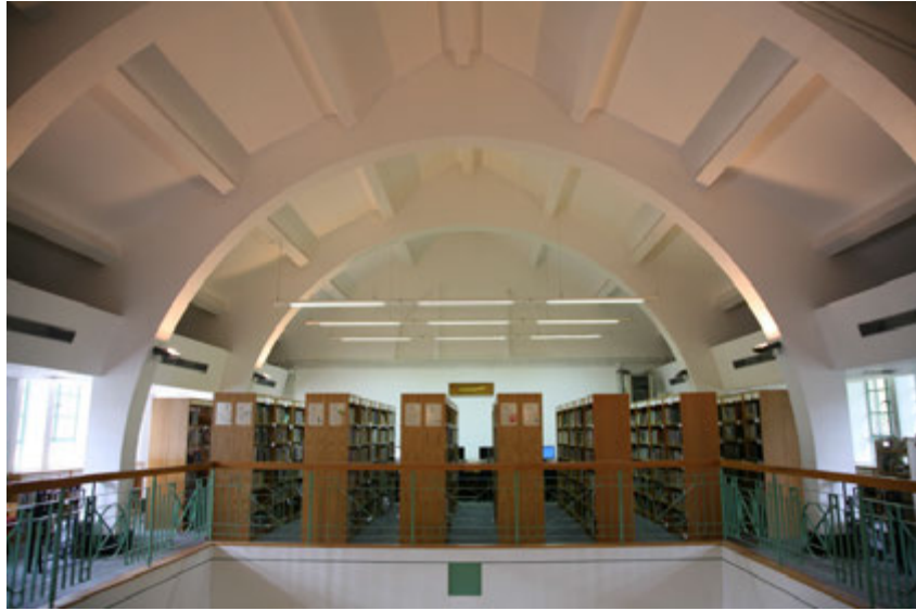
中座圖書館的屋頂