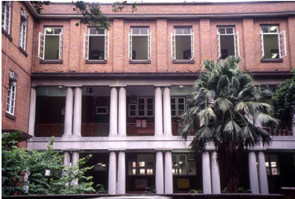
從般咸道望向校舍南翼的景觀