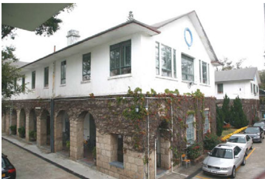
聖士提反書院的書院大樓