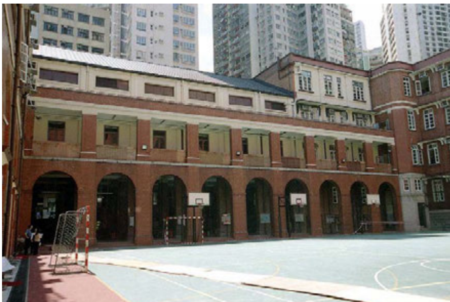
從露天操場望向校舍東翼的景觀