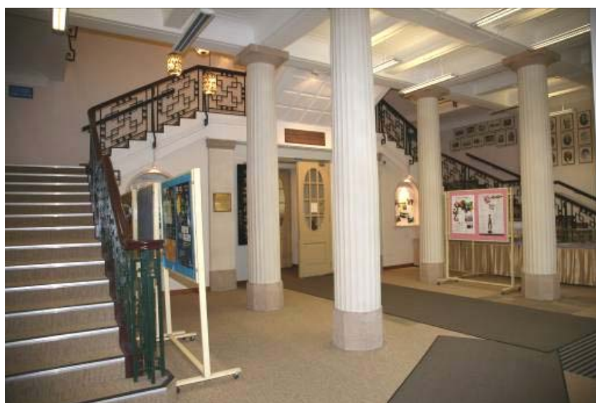
書院大樓的入口大堂