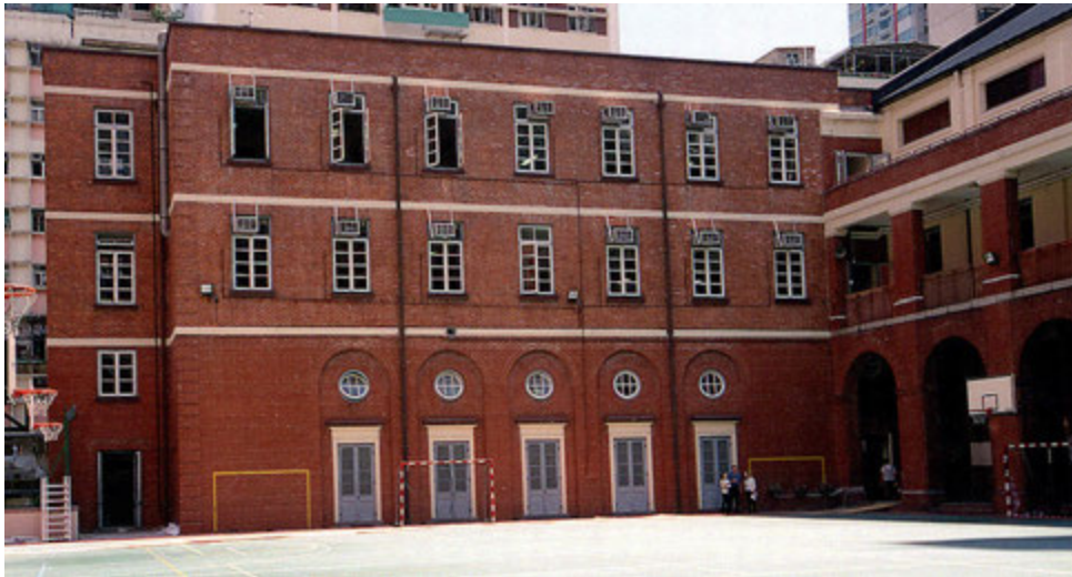
從露天操場望向校舍北翼的景觀